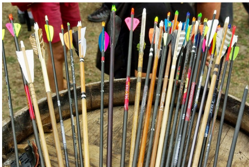
A chacun sa flèche !